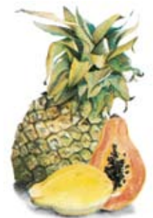
Ananas und Papaya – Früchte mit natürlichen Enzymen

Die fehlenden körpereigenen Enzyme können durch astoral Almazyme, einem Enzym-haltigen Futterzusatz in Pulver- oder Tablettenform ersetzt werden. astoral Almazyme enthält zudem Lecithin für einen optimalen Fettaufschluss sowie B-Vitamine für eine gute Verarbeitung der Nährstoffe im Körper.